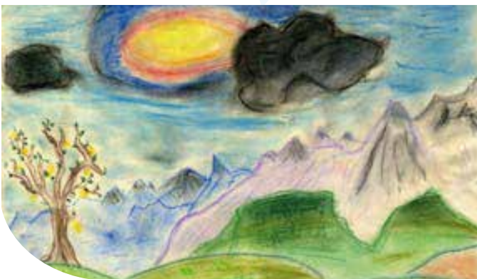
Während der Erkrankung der Mutter